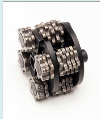
Randfrästrommel HML 6/45/15

Standard-Frästrommel bestückt mit HML 5/45/15 Hartmetall-Lamellenfräser mit eingelöteten Hartmetall-Stiften, zum Abfräsen von Beton und Estrich, Fliesenkleber, Versiegelungen, auch zur Oberflächenreinigung bei Verkrustungen. Ergibt eine grobe Oberflächenstruktur, sehr gute Abtragsleistung, normale Standzeit.