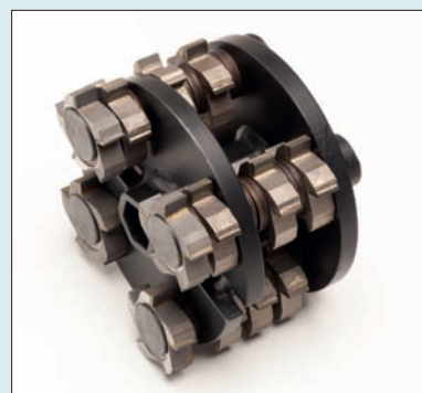
Randfrästrommel HMF 5/40/15

Frästrommel bestückt mit HMF 5/40/15 Hartmetallfräser mit Vollhartmetallschneiden, zum Abschälen von Spachtelmasse, Kleber, Beschichtungen, Abdichtungen.