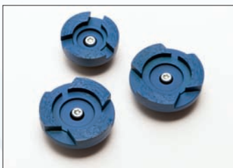
Schleifteller-Set Diamant blau, für abrasive Materialien (Estrich)