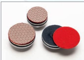
Velcro-Aufnahme-Set mit flexiblen, galvanischen Diamant-Schleifscheiben

Der Trio DTS 850 ist ein handlicher Eckenschleifer mit 3 Schleiftellern. So kommen Sie bequem in Ecken und Winkel. Das geringe Gewicht erlaubt auch über Kopf zu arbeiten. Natürlich mit Staubabsaugstutzen ( \varnothing 27 mm) für staubfreies Arbeiten.