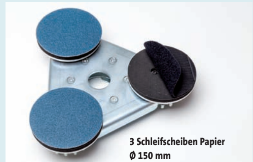
3 Schleifscheiben Papier Ø 150 mm

Trägerteller zum Schleifen , mit angetriebenen Werkzeugaufnahmen für kontrarotierende Anwendung. Die Klettaufnahme des Werkzeugträgers wird geschützt durch die Verwendung zusätzlicher austauschbarer Klettadapter.