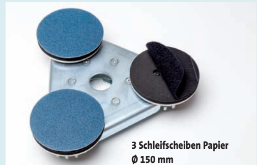
3 Schleifscheiben Papier Ø 150 mm

Trägerteller zum Schleifen , Werkzeugaufnahmen für kontrarotierende Anwendung.