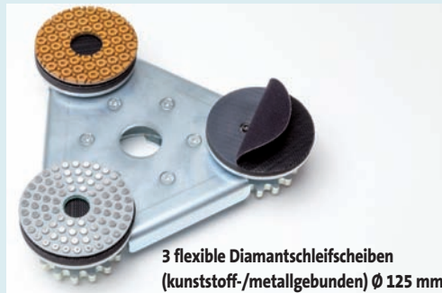
3 flexible Diamantschleifscheiben (kunststoff-/metallgebunden) Ø 125 mm