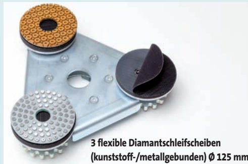
3 flexible Diamantschleifscheiben (kunststoff-/metallgebunden) Ø 125 mm