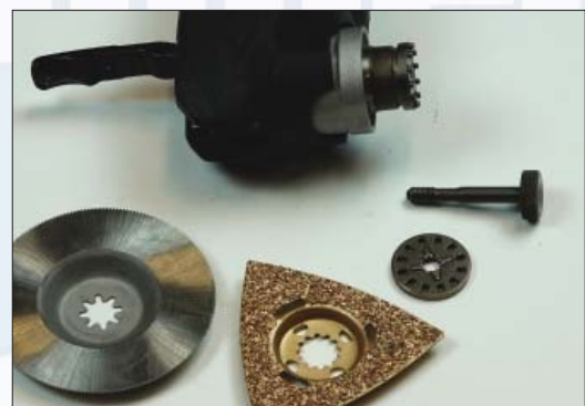
7. Adapter-OIS-Multitool 1-tlg. (Scheibe) Art.Nr. 327.222