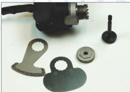
6. Adapter-OIS-6-kant, 2-tlg. (Bolzen + Scheibe) Art.Nr. 327.221

5. Diamant-Segmentmesser mit OIS-Aufnahme zum Schleifen an Ecken/Hindernissen wandbündiges Aufschneiden von Fugen, Rissen etc. Art.Nr. 281.026 2,8mm breit