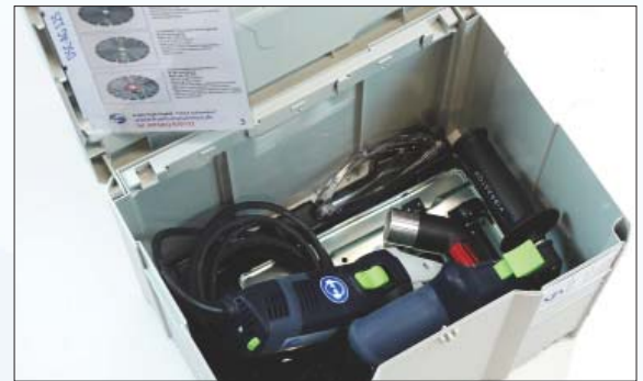
DSC-AG 125 Fugenschneider im Systainer Art. Nr. 032.700

Der DSC-AG 125 ist ein Fugen- und Risschneider im Systainer