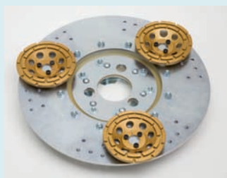
Trägerelemente Diamant, gepuffert, Ø 400 mm, für diverse Werkzeuge, z.B. mit 3 doppelreihigen Diamantschleiftöpfen Ø 125 mm zum Anschleifen von Beton, Estrich, etc.