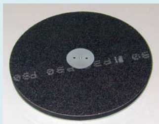
Schleifteller Ø 400 mm, mit flexibler Unterlage für Papier doppelseitig und Hartmetallschleifscheibe