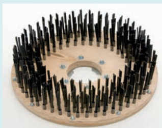
Bürste Stahlflachdraht Ø 400 mm (ölgehärtet): Reinigen von Betonböden und Pflastersteinen, Einbürsten von Haftbrücken