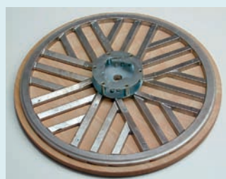
Holzabreibescheibe Ø 400 mm, zum Abreiben von Gussasphalt