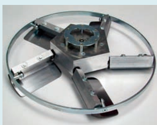
Flügel-Glätteteller Ø 600 mm mit Metall- oder Kunststoffflügeln zum Glätten von Zement- und Anhydrit-Estrichen und Beton