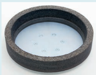
Schleifring Ø 400 mm, Korn 16: Abschleifen von rauen Estrich- und Betonflächen