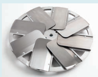
Glätteteller Ø 600 mm mit 8 Glättflügeln aus gehärtetem Stahl