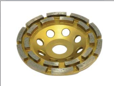
DIAMANT-Schleiftopf Standard Ø 125 mm DT-125-MBT-C, Segmenthöhe 6,5 mm Doppelreihig, GOLD, Art.-Nr. 229.123 für harte Untergründe, zum Schleifen von Beton, Industrieestriche, Spachtelmasse, Fliesen