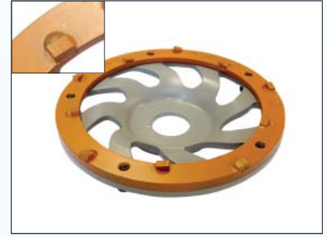
DIAMANT-Frästopf Ø 125 mm DFT-125-10, ORANGE, Art.-Nr. 223.503 mit 10 PKD zum Abtragen dünner Schichten (Farbe, Neopren-, Kunstharz-, Bitumenkleber) auf glatten Untergründen/ Holz. Abfräsen von dünnen CV-Belägen. Kein Altbeton! Diamantfräsring Verschleißteil DFR-125 ORANGE, Art.-Nr. 223.514