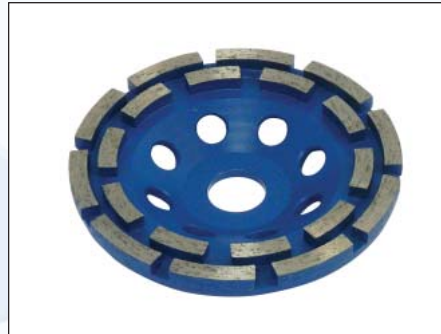
DIAMANT-Schleiftopf Standard Ø 125 mm DT-125-MBT-A, Segmenthöhe 6,5 mm Doppelreihig, BLAU, Art.-Nr. 226.210 für abrasive Untergründe wie Estrich, verregener Beton, aufgesandete Beschichtungen