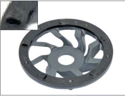
DIAMANT-Frästopf Ø 125 mm DFT-125, SCHWARZ, Art.-Nr. 223.500 mit 5 PKD-Segmenten, zum Abfräsen Kleber (Bitumen-, Kunstharz-, Fliesenkleber), Spachtelmasse auf Estrichen und Holz, Beschichtungen, Estriche (Zement, Anhydrit, Holz) Diamantfräsring Verschleißteil DFR-125 SCHWARZ, Art.-Nr. 223.510