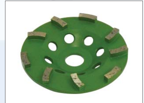
DIAMANT-Schleiftopf TURBO, GRÜN für harte Materialien wie Estrich/Beton mit Hartstoff, Naturstein, Feinsteinzeug, etc. DT-125-TURBO-16/20 Art.-Nr. 223.231