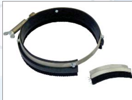
Ersatz-Bürstenring komplett Art.-Nr. 323.422 Ersatz-Bürstensegment Art.-Nr. 323.436

Zum Abschleifen von dünnen Klebern, Farben, Spachtelmassen auf Beton