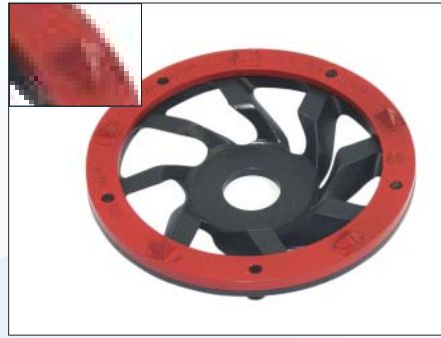
DIAMANT-Frästopf SPITZ Ø 125 mm DFT-125 S, ROT, Art.-Nr. 223.501 mit 5 PKD-Segmenten spitz. Aggressiveres Werkzeug zum Abfräsen dünner Kleber oder Farbschichten, Vliesrücken, Beschichtungen Diamantfräsring Verschleißteil DFR-125 ROT, Art.-Nr. 223.511